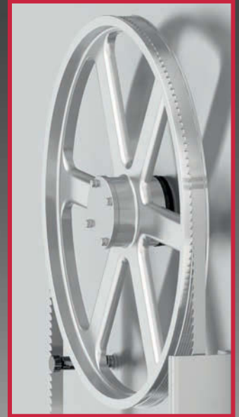
Stainless steel pulleys with double rim. Poulies en acier inoxydable avec double rebord. Poleas inoxidable con doble pestaña. Edelstahl Laufrad mit Doppelbord.