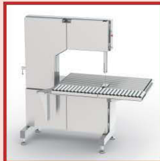
Rollers table / Table rouleaux Mesa rodillos / Rollentisch