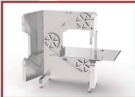
Fix table / Table fixe Mesa fija / Schiebetisch